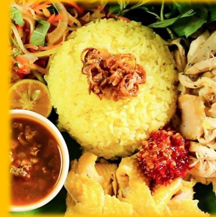
Cơm Gà Hội An Riz au poulet 11.90€