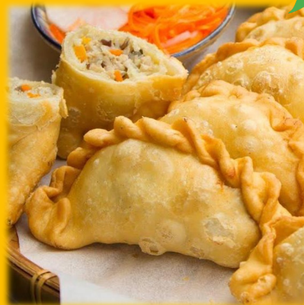
Bánh Gỏi 4.50€ Beignet farcie aux crevettes x2