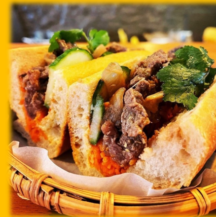
Bánh Mì 5€