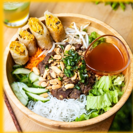
Bò Bún 11.90€